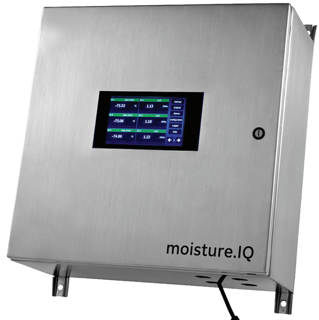
Versión a prueba de intemperie

El moisture.IQ puede aceptar entradas de sondas Panametrics MIS y sondas de la serie M que estaban disponibles para los analizadores Moisture Image serie 1 y Moisture Monitor serie 3. Las sondas MIS (MISP y MISP2) proporcionan entradas integrales de humedad, temperatura y presión. Los datos de calibración de esos sensores se almacenan digitalmente. Cuando se conecta al analizador, los datos de calibración se descargan en el moisture.IQ.