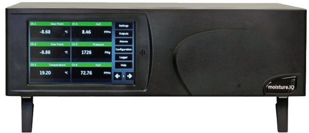
Versión de montaje en banco

El moisture.IQ es el modelo multicanal y multifunción insignia de la serie IQ de Baker Hughes de analizadores Panametrics de humedad basados en óxido de aluminio. El moisture.IQ mide trazas de humedad, presión y temperatura en líquidos no acuosos y gases. Acepta entradas de sensores electroquímicos para medir la concentración de oxígeno en gases. Las entradas auxiliares pueden aceptar señales analógicas de cualquier transmisor con salida 0/4 a 20 mA o -1 a +4 V, incluida una variedad de instrumentos de control de procesos Panametrics; esta prestación hace que el moisture.IQ sea un auténtico analizador multifunción que ofrece ahorro de costes mediante la integración en el sistema.