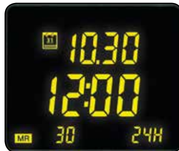
Pantalla de fecha y hora del almacenamiento de mediciones