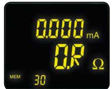
Indica que la impedancia es mayor a 1500 Ω