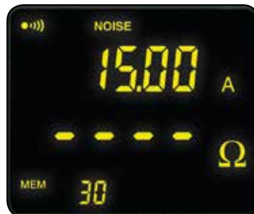
Indica que la corriente es mayor a 10 A