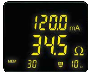
Indica el umbral de la alarma de corriente o tensión junto con la dirección de impedancia