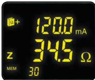
Muestra la corriente de fuga y la impedancia del bucle en la frecuencia de prueba