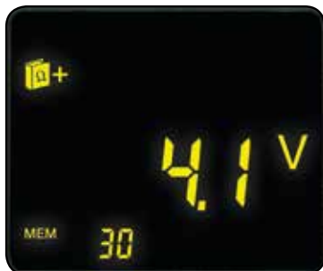
Indica la tensión potencial en el punto de medición